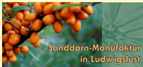
Sanddorn-Manufaktur in Ludwigslust

Wir besuchen Deutschlands ältestes Sanddorn-Anbaugebiet in Ludwigslust. Die kleinen, aber Vitamin C reichen Früchte werden auf Plantagen angebaut und dann zu außergewöhnlichen Spezialitäten wie Tees, Kosmetik, Aufstriche oder Alkoholisches weiterverarbeitet. Bei einer Führung erfahren wir Interessantes über den komplizierten Anbau, die mühsame Ernte und was man mit Sanddornsaff und Co. so alles machen kann.