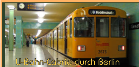
U-Bahn-Cabrio durch Berlin

Dienstag, 21.06. ab 14:00 Uhr Donnerstag, 30.06. ab 15:00 Uhr