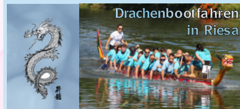
Drachenboofahren in Riesa

Selbstkostenanteil: 28,00 € (regulärer Preis: 53,00 €)